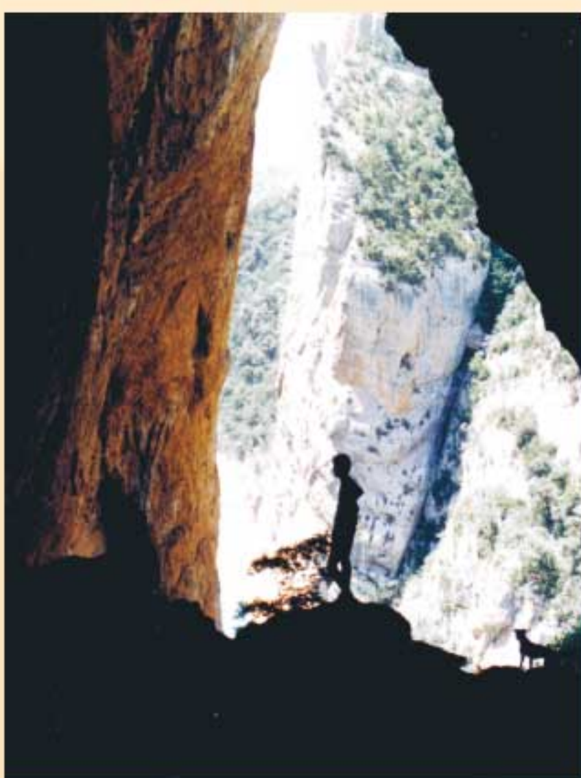
5. Cova Colomera