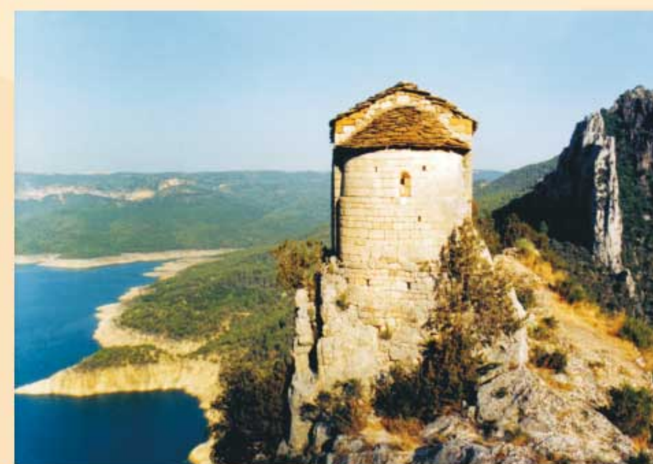
2. Mare de Déu de la Pertusa