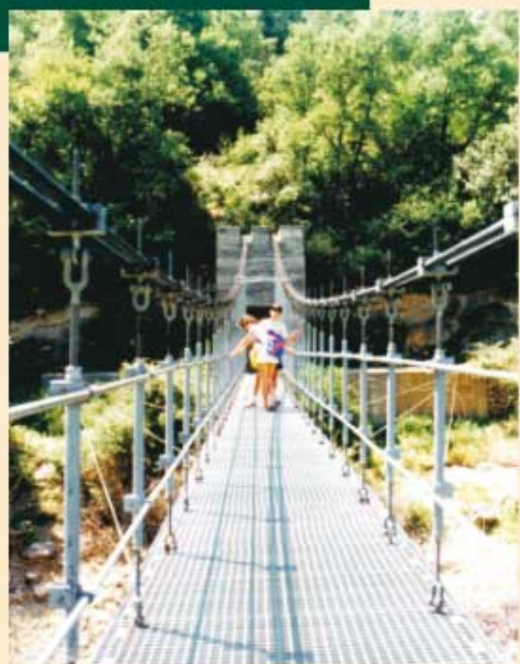
6. Pont penjant - Final