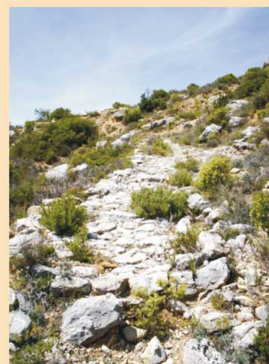
2. Via romana