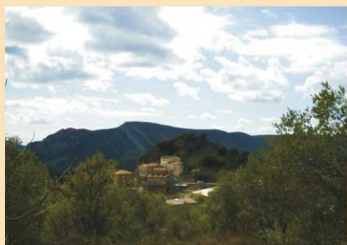
1. Corçà- Inici