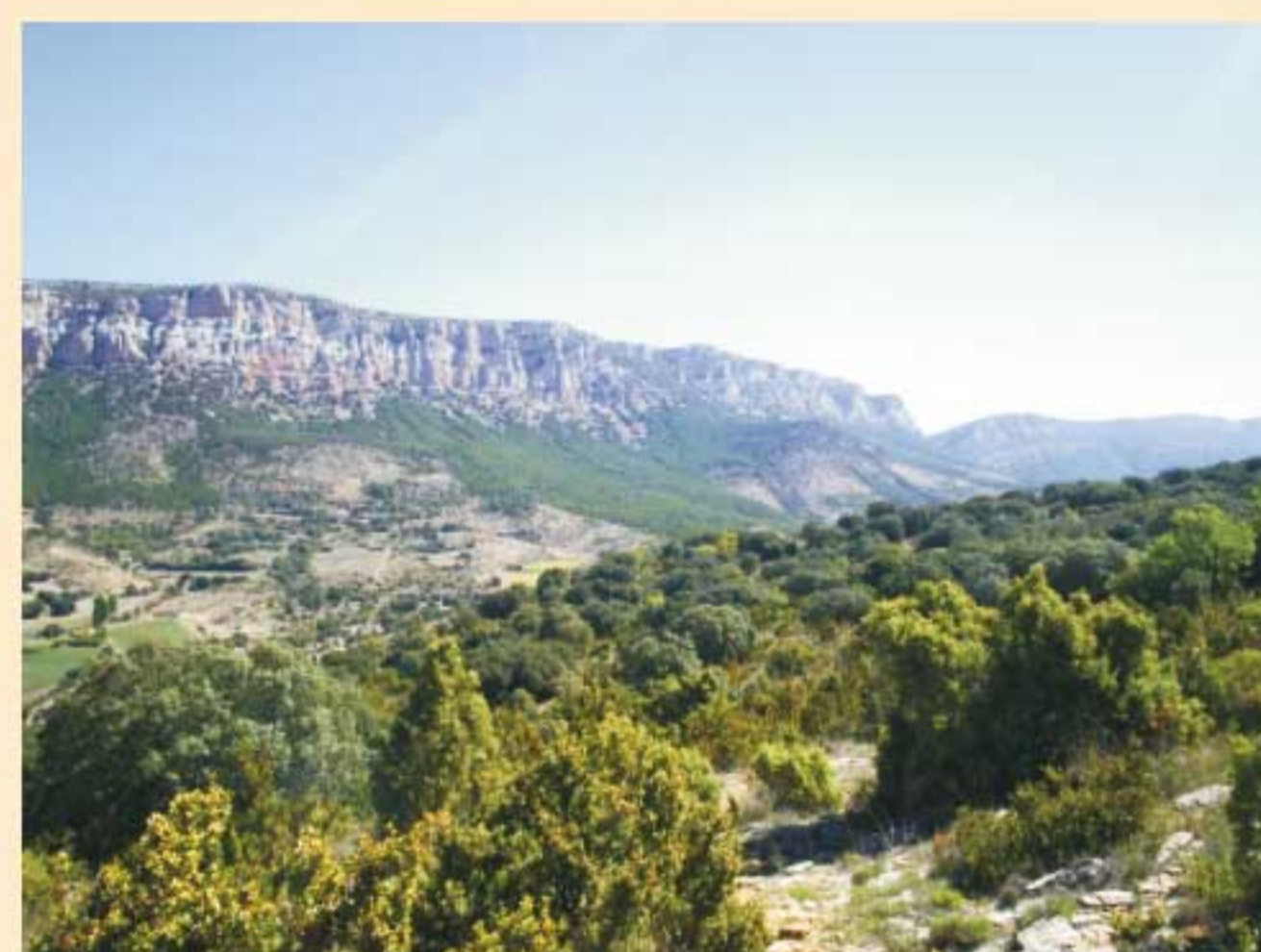
4. Altura màxima