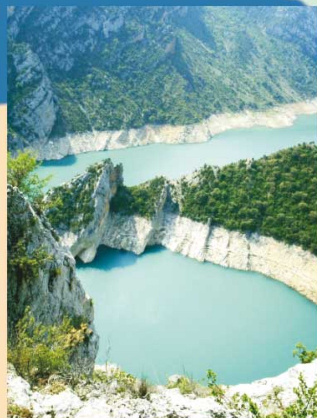
Congost de Fet